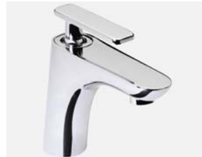
Miber Monomando C100