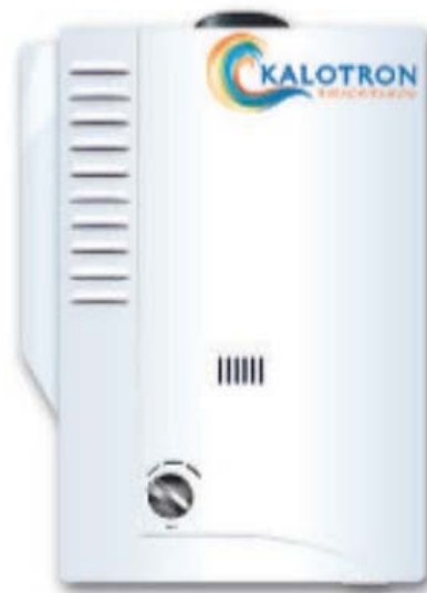
CALENTADOR KALOTRON THERMOINTELLIGENT

Ahorra hasta el 95% en el consumo de gas combinado con el calentador solar