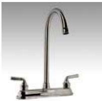
Miber Acuamatica 300

Cocina DIAMANTE Miber Cocina Mezclomatica Miber Cocina Aquamatica 200 Miber Cocina AquaMAT 300 Miber Euromando 100 Miber Monoomando premium 400 Cocina AquaMAT 301 flex Miber MONOMANDO COCINA Miber