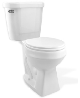
Alargado blanco Jazmín