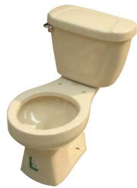
Redondo Marfil Jazmín