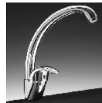
Miber Euromando 100