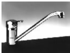
Miber Monomando 100