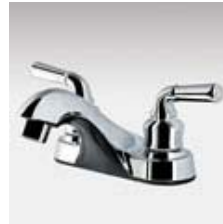
Miber Aqualav 300